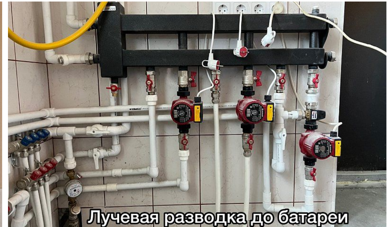
Лучевая разводка до батареи