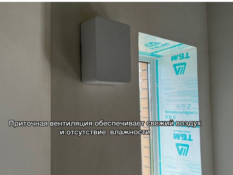
Приточная вентиляция обеспечивает свежий воздух и отсутствие влаги